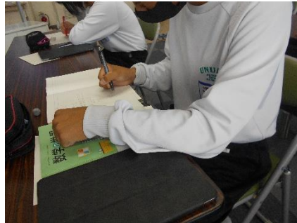
【自分一人の力で解決する姿】