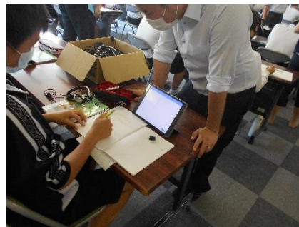
【タブレットを活用】