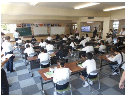
【南多目的ホールで授業】

生徒のみなさんは、「分からない人が分からないと言えること」、「分かる人が分からない人に寄り添えること」を自分達の目標として掲げて取り組みました。目標を達成するために、タブレットを活用したり、仲間との学び合いをしたりして、分からないことを分かるまで、学びを高めることができました。