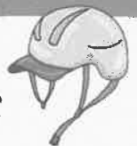
(%) ヘルメット着用状況別の致死率比較 (令和2年)