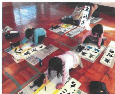
<3年生の書き初めの様子>

今年度も各学級で距離をとって行いました。作品は、各教室の廊下掲示版に掲示をしています。授業参観の際には、またご覧いただきたいと思っています。