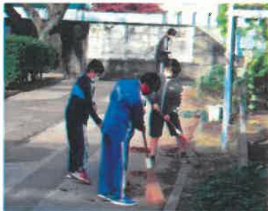
<朝、自主的に落ち葉を集めている児童>

自らの強い意思をもって、いろいろなボランティアの内容に挑戦をする子、ボランティア手帳を何冊か達成することを自らの誇りとしてがんばっている子、ボランティア活動歴50回認証は達成させようと取り組んでいる子、子どもたちによってその取り組みの姿勢はまちまちです。それでも、12月1日になって、ボランティア活動歴50回（ボランティア手帳1冊終了）以上やっている子が、増えてきました。