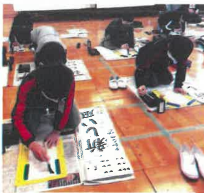
<5年生の書き初めの様子>