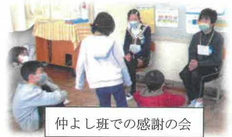
仲よし班での感謝の会

5年生リードのもと、集会の前半は、1～6年生の仲よし班(縦割りの班)でお別れの会を行いました。いつもは、6年生が遊びを企画運営するのですが、この日は5年生が企画した楽しい遊びを進行することができました。遊びの後は、それぞれの仲よし班の1年生～5年生が今までお世話になった6年生に一人一人感謝の言葉を伝えました。感謝の言葉を伝えられた6年生は、大変嬉しそうでした。