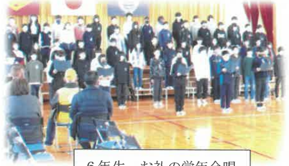
6年生 お礼の学年合唱