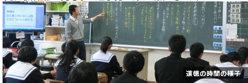
道徳の時間の様子