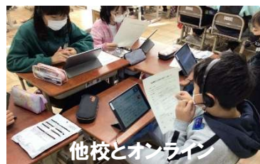
他校とオンライン