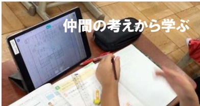
仲間の考えから学ぶ