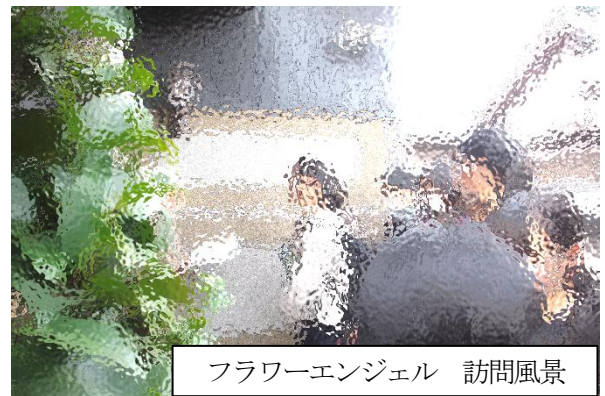
フラワーエンジェル 訪問風景

12月17日(火)に緑陽中の伝統的な生徒会行事である『フラワーエンジェル』を行いました。校区内に住んでみえるお年寄りのお宅を訪問し、ふれあいを深めるものです。当日は、生徒たちが鉢花と手紙を持って伺いました。生徒との交流を楽しみにしてみえる方も大勢いるとかがっています。これからも、心がつながるお年寄りの方との交流を続けていきますので、よろしくお願いいたします。