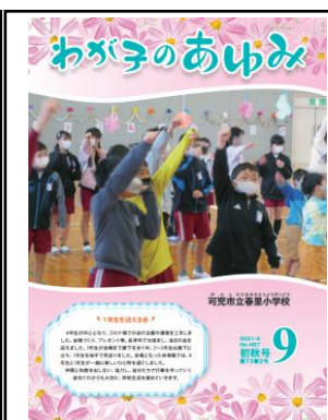
9月号 (可児市立春里小)