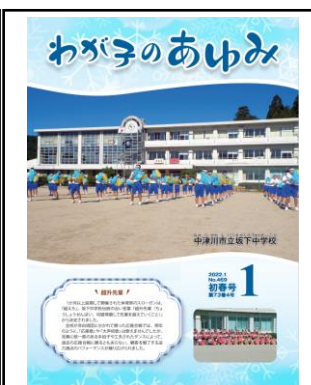
1月号 (中津川市立坂下中)