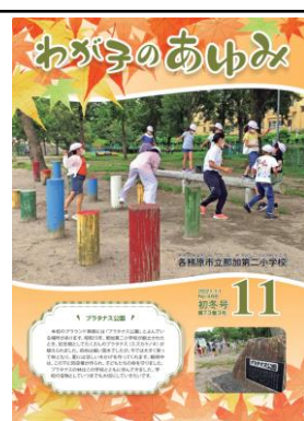
11月号 (各務原市立那加第二小)