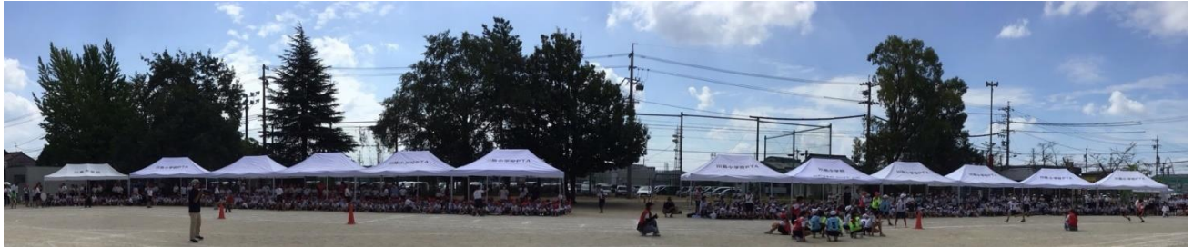
4年ぶり、小学校運動場での全校による運動会

9月30日、素晴らしい秋晴れの天気のもと、運動会を行いました。今年度は、熱中症対策のため競技以外は室内で実施しました。