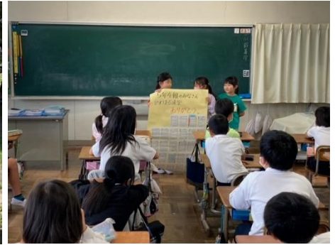
下学年から上学年へのお礼

5月16日に、川島小学校伝統の「かわまる遠足」がありました。かわまる遠足のねらいは、「異年齢集団での共同体験を通して遊びを楽しんだり互いのよさを見つけたりすることでよりよい関係をつくる」です。