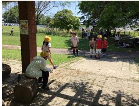
かわまる遠足 当日の様子