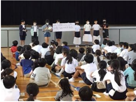
ペア学年による合同計画会の様子