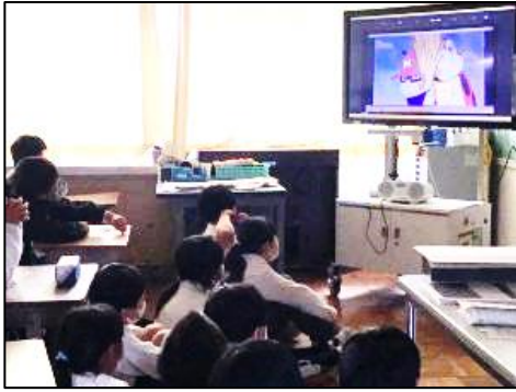
1～3年生「むしむし村のなかまたち」