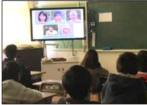
4～6年生「だれを先に乗せる？」