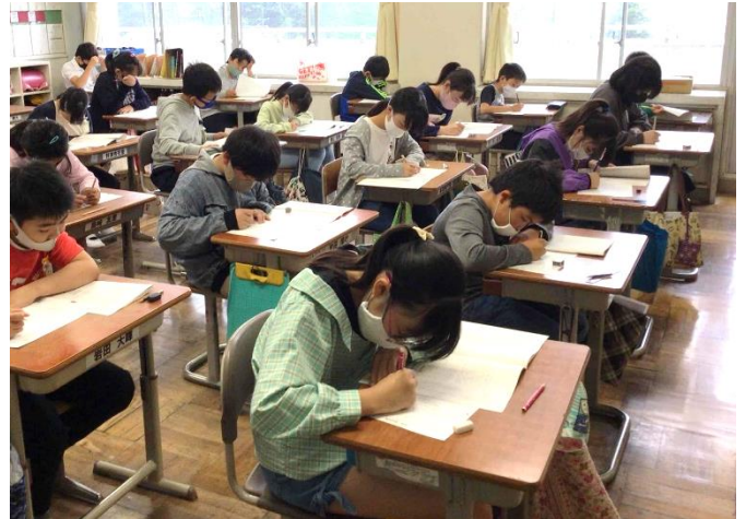
全国学力学習状況調査に挑む6年生

6月に入りました。今月は、「日常生活を高める」という意識をもって、「授業」や「係活動」を充実させていきたいと考えています。6年生からの呼びかけです。