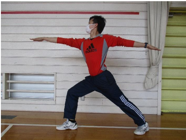
⑨せんし 戦士のポーズ II