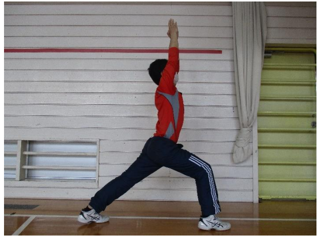
⑧せんし 戦士のポーズ I