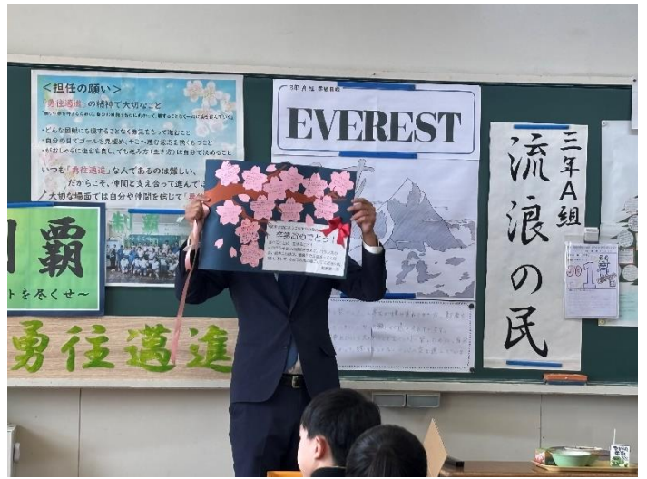
調理員さんから、メッセージをいただきました。ありがとうございました。