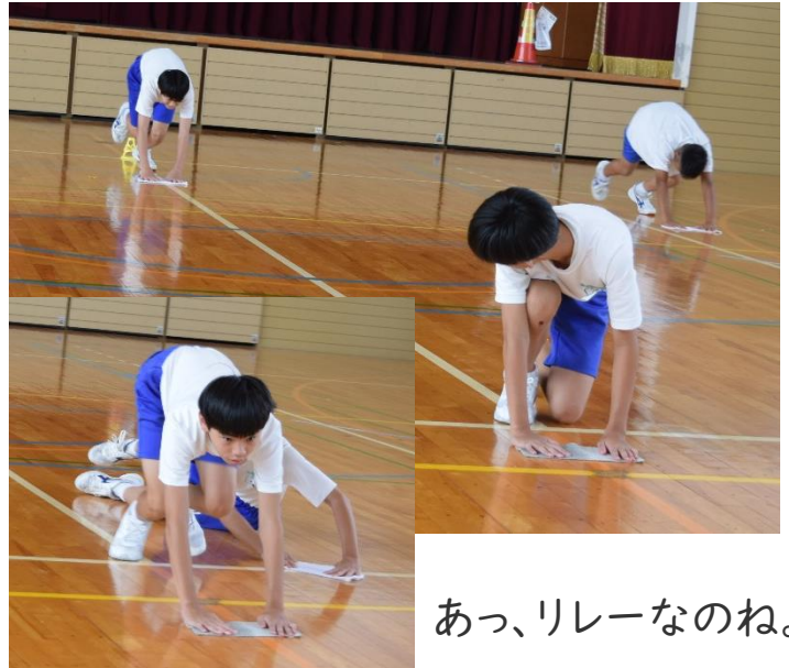
あっ、リレーなのね。