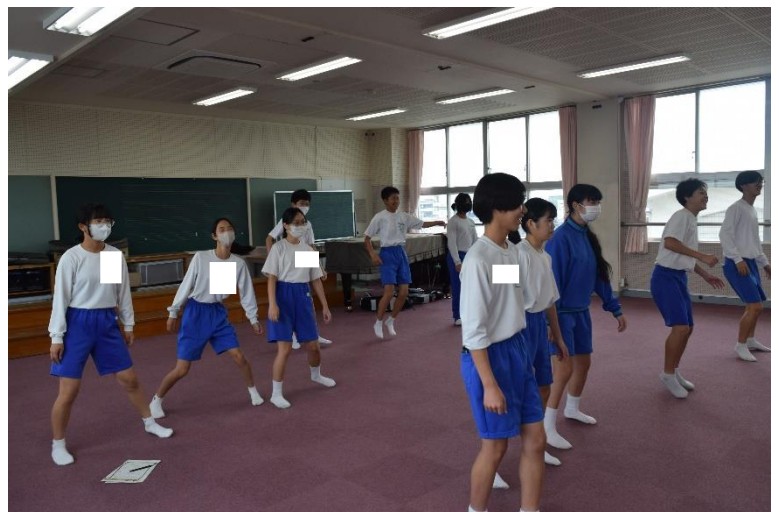
だるまさんが転んだ?