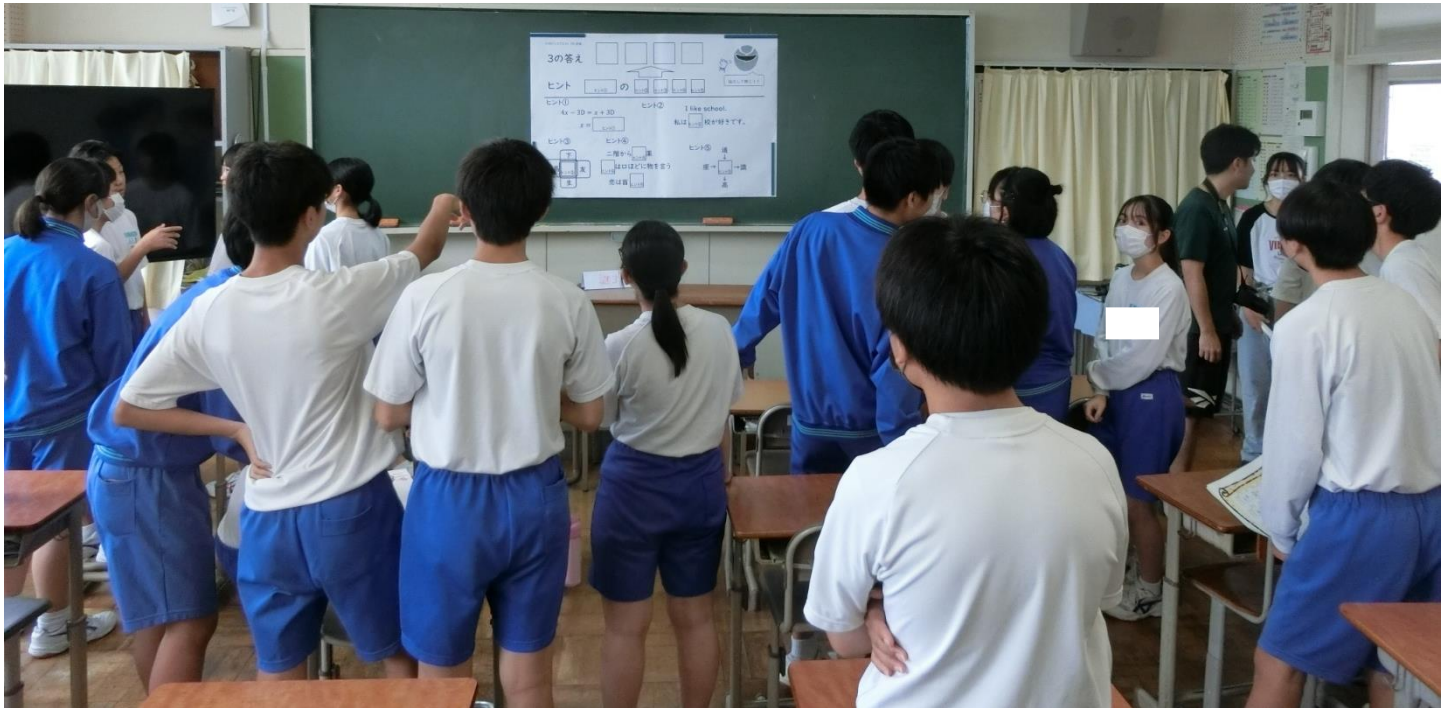
何だこれ？ あっ、「美術室の机の上でプログラミング体験中」かあ...