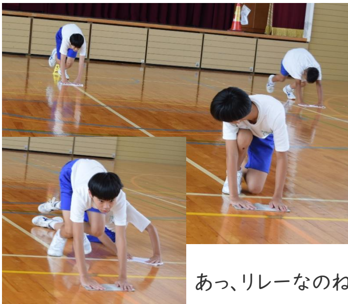
あっ、リレーなのね。