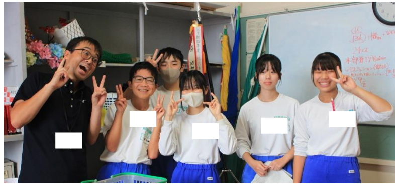
みんな楽しそう!! 頭を悩ませています...