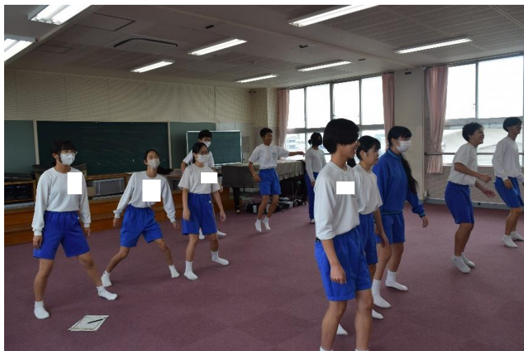
だるまさんが転んだ?