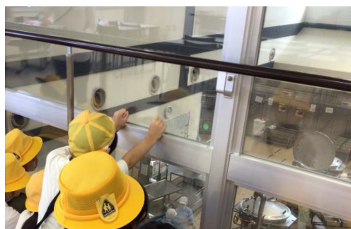
<2年生・給食センター見学>

各学年の校外学習や社会見学が始まりました。校外学習や社会見学では、教室で教科書や資料を使って学んでいることを、実際の現場や建物、施設を見学したり体験したりすることで、社会の仕組みや価値を知ったり、文化や歴史に触れたりすることができます。実際に見ると、興味をもち、「もっと知りたい」と、学びの広がりにつながります。時には、将来の生き方や仕事にも関わってくることもあります。見学したことをまとめ、発表することで、自分の学びを整理し発信します。また、集団行動をするときの約束や、公共施設でのマナーを学ぶ機会でもあります。先日、2年生と一緒に各務原市学校給食センターへ、3年生と一緒にスーパーへ校外学習に行ってきました。2年生は、給食がつけられているところを見学し、帽子をかぶる体験や大きなしゃもじを使ってかき混ぜる疑似体験を行いました。鍋やしゃもじの大きさに驚きました。3年生は、働いてみえるお店の方やお客さんに、大変上手にインタビューをしていました。班でまとまって行動することも大切にできました。1年生は、秋見つけに出かけました。大きなどんぐりや、秋色の葉を拾ってきました。それらを使って、工作を楽しみます。6年生は、修学旅行の見学先について調べ学習をしています。「パスポート」を手に入れるために、校長室で確認テストを行ってきました。事前に調べたことを、実際に見たり聞いたりすることで、確かめたり、新たな発見をしたりすることを期待しています。4年生・5年生は、すでに社会見学は終わっていますが、次の宿泊研修に向けての取組が行われるようです。社会見学での振り返りを基に、更に成長することでしょう。これらの活動については、事前の学習や